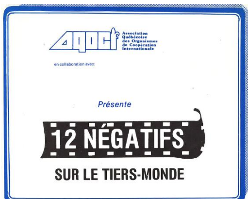
Calendrier. 1982